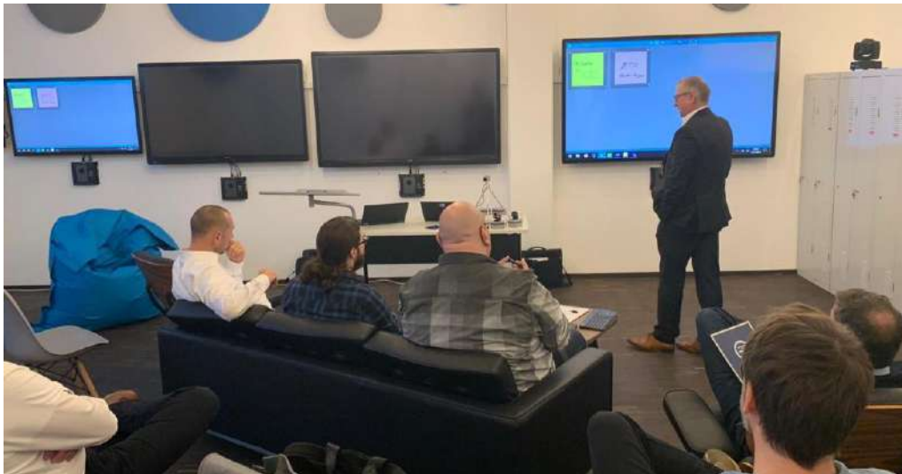
November 2019 Demo för German Aircraft Manufacturer med partner ComPeri.