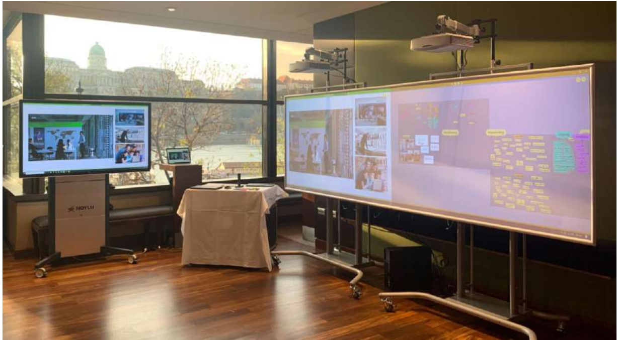
November 2019 Demo och träning för Merck Pharmaceuticals kontor i Budapest.