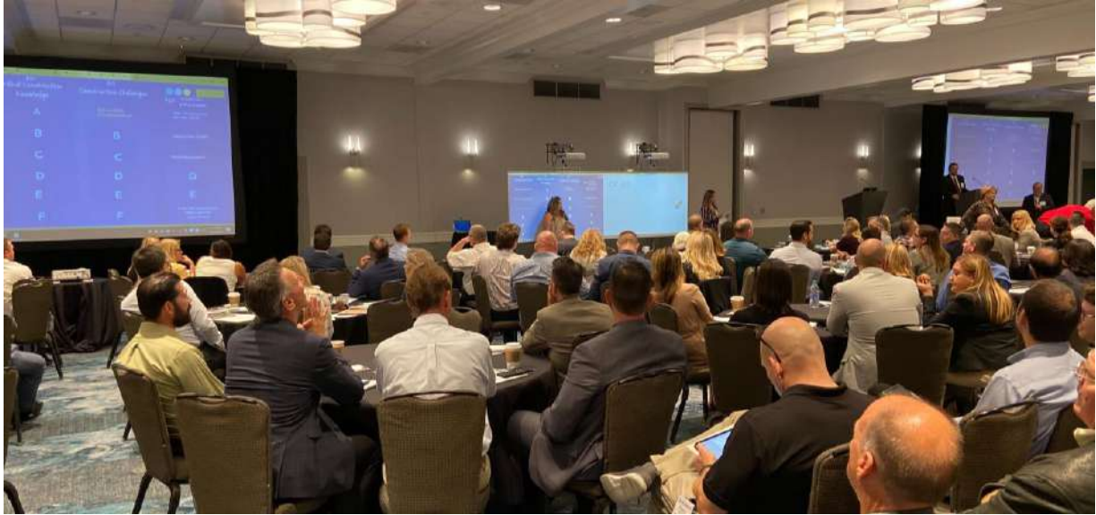
October 2019 California's Coalition for Adequate School Housing höst konferens i Newport Beach, California.