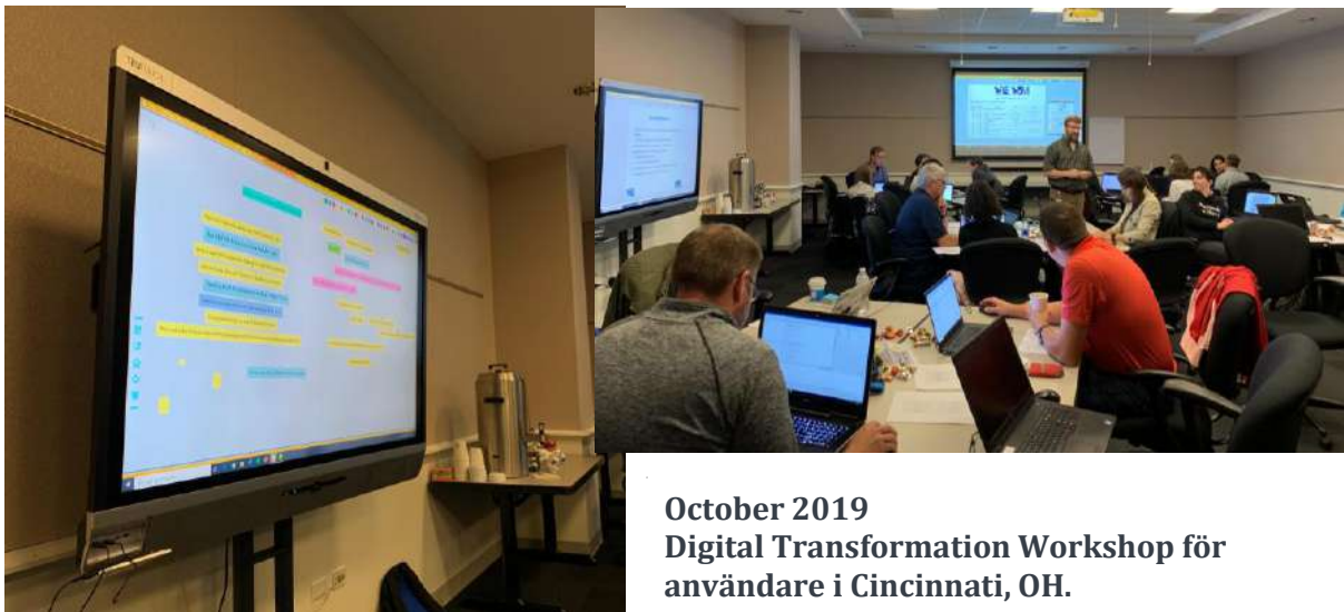
October 2019 Digital Transformation Workshop för användare i Cincinnati, OH.