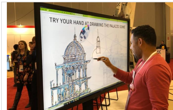
Utbildning, Aoyama University