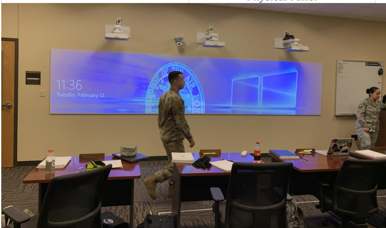
Utbildning, amerikanska flygvapnet