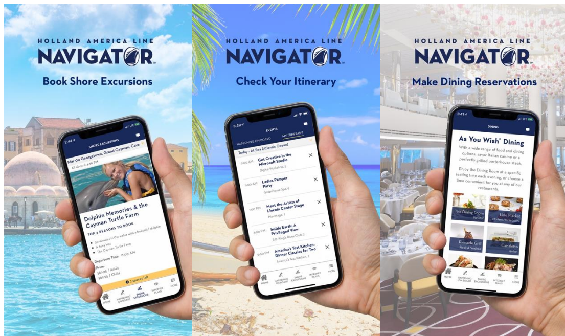
Holland America Line Navigator mobilapplikation

krav på dataintegritet och säkerhet. Under året har vi framgångsrikt genomfört ett antal externa säkerhetsgranskningar för att kvalificera oss som leverantör åt större kunder.